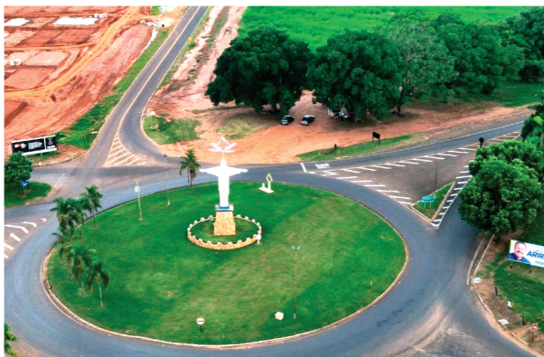
Por Alilton Silva Jornalista

Menos pressa, menos custo — e a sensação de que a vida cabe no dia