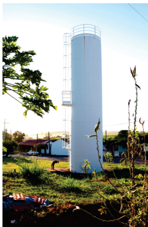
Dinheiro público mal gasto. Perfuração de poço semiestructural e implantação de reservatório em local mal planejado geram revolta na população, que sofre com a falta de água.